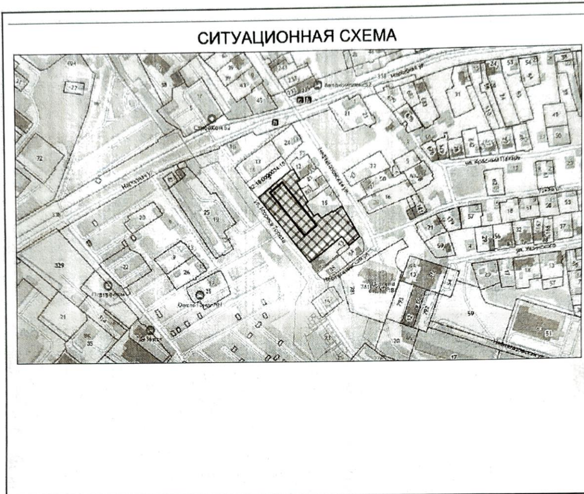
Схема границ подготовки инженерных изысканий

графические приложения (чертежи) в формате «*.dwg», «*.pdf».